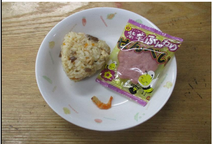
【おやつ:以上児】炊き込みおにぎり・焼き干しえび・お菓子