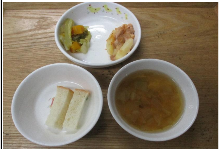
【離乳食】食パン・鶏肉のケチャップ焼き・彩りサラダ・キャベツのスープ