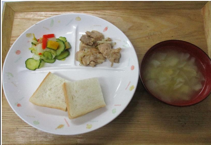
【普通食:以上児】食パン・タンドリーチキン・彩りサラダ・キャベツのスープ

今日はパプリカについてです。100g以上の大型の肉厚ピーマンのことをパプリカと呼び、色は、赤やオレンジなどカラフルです。また、紫や黒、茶、白といっためずらしい色もあります。パプリカは、ピーマンのような青臭さや苦みがなく、甘くて、食感がジューシーなため、煮込み料理の他、サラダなどの生食にも向いています。